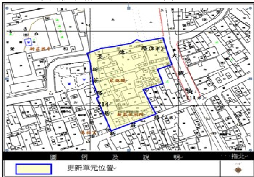
圖 2-1 基地位置圖

本單元位處於新北市新海橋下西側街廓，基地北臨景德路、東側為大觀街、南側為新莊路、西側臨新莊路 214 巷所圍街廓以及慈祐宮古蹟保存區（詳圖 2-1）。基地南側臨新莊廟街牌樓、西北側為新莊國中校園，周圍多為深具特色與濃厚歷史人文氣息之街道建築，結合當地特色美食產業及鄰近捷運新莊線新莊站出入口，區位獨特。