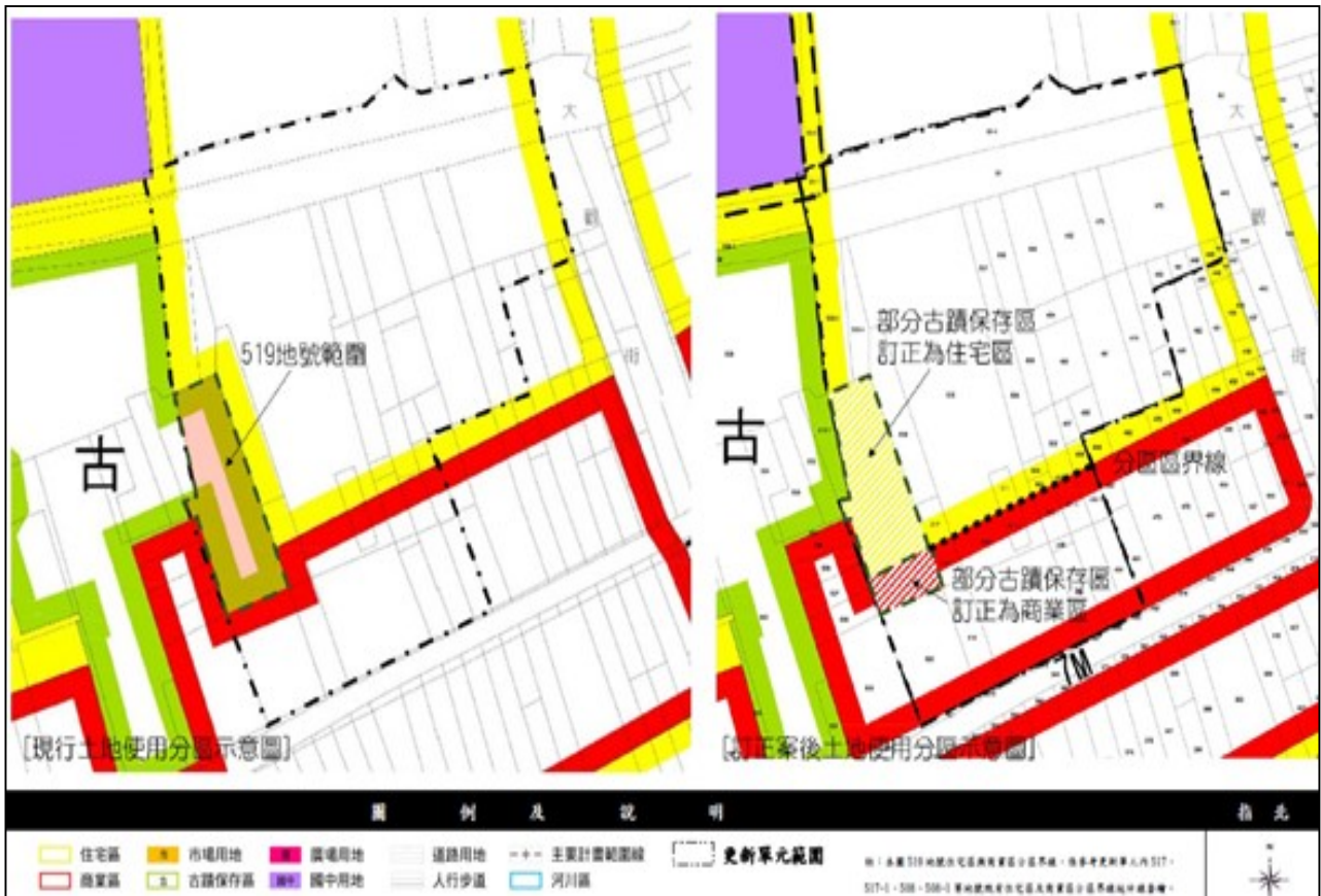
圖 3-1 本案都市計畫變更後土地使用分區示意圖